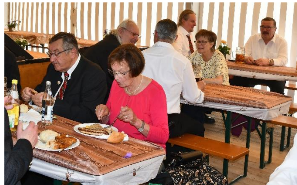
Die Stärkung nach getaner Arbeit