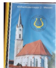
Kirchenliedermappe - Messen

Hierzu gilt, dass die Lieder, die zur Vorbereitung für ein Konzert oder einen Auftritt benötigt werden für die Dauer der Vorbereitung und für die Aufführung so in die Konzertmappe so einzuarbeiten sind, wie es vom