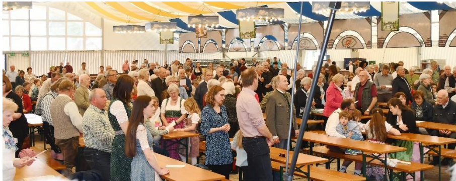
Gut besucht war der Volksfestgottesdienst 2023